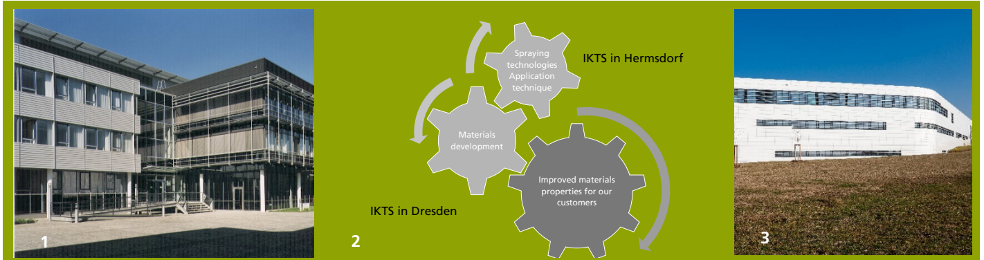
1 Fraunhofer IKTS in Dresden-Gruna.